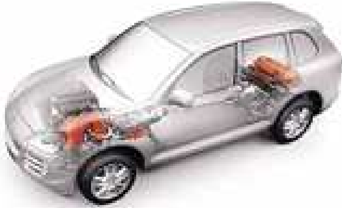
Bild 1: Beim typischen Hybridkonzept - hier Porsche Cayenne - sitzen der Elektromotor vorn und die Batterien im Heck des Fahrzeugs.

Immer mehr Autofahrer setzen auf den Hybridantrieb - ein Antriebskonzept, das helfen soll, die Reduktion von Emissionen voranzutreiben. Eine Übersicht.